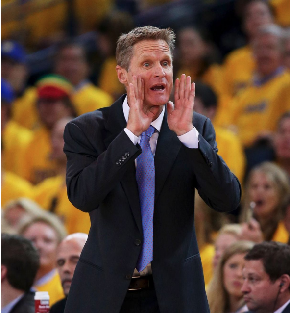
Steve Kerr in coaching mode