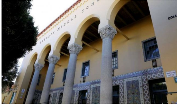
Everett Middle School San Francisco, CA